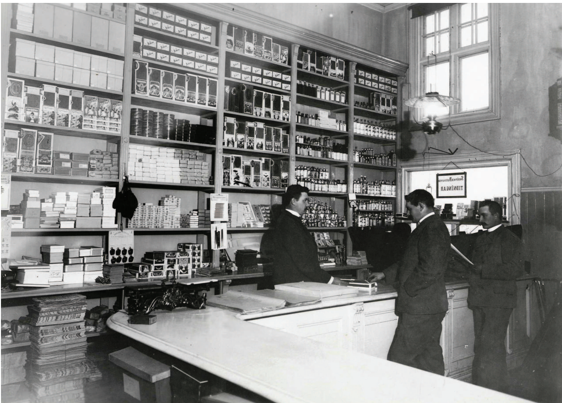
Fotografiet från Greens affär är ur Stadskamreren Hjalmar Falks, Jukkasjärvi sn, samling.

En ny förändring i förändret av handelsregistret kom i och med en lagförändring 1992 som innebar att funktionen att föra handelsregister övertogs av Patent- och Registreringsverket (PRV) i Sundsvall. Sedan en ombildning år 2004 är det Bolagsverket som har uppgiften att registrera firmor. Handelsregistren hos länsstyrelsen upphörde i och med utgången av 1994.